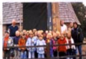
Kinder der Hiltner Mühle

Kosten: 5,- Euro pro Person darin enthalten ist eine Brotmahlzeit mit selbstgebackenem Brot und einem Getränk.