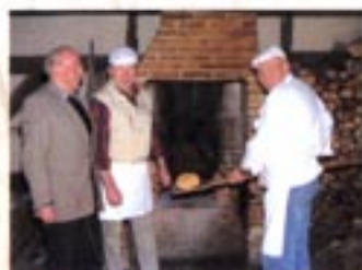
Unsere Bäcker im Backspeiker

Vom Korn zum Brot geeignet für Schulklassen und Gruppen jeden Alters