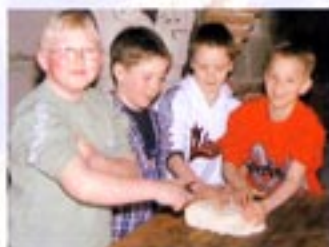
Brot backen in Oberlangen ...