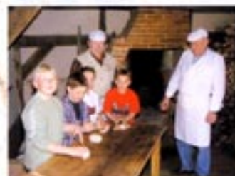
Brot backen unter Anleitung