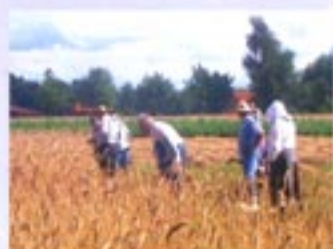
Historische Roggenernte ...